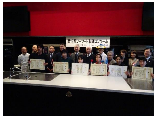
写真1：第19回シーフード料理コンクール受賞者記念写真