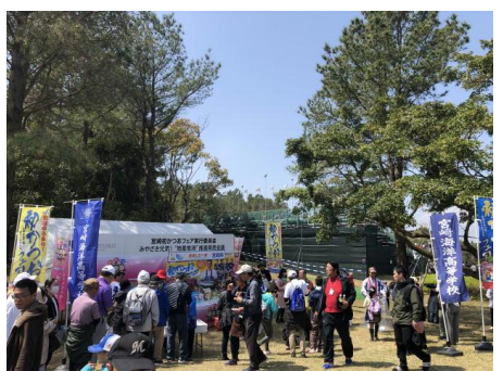
■宮崎のさかなビジネス拡大協議会