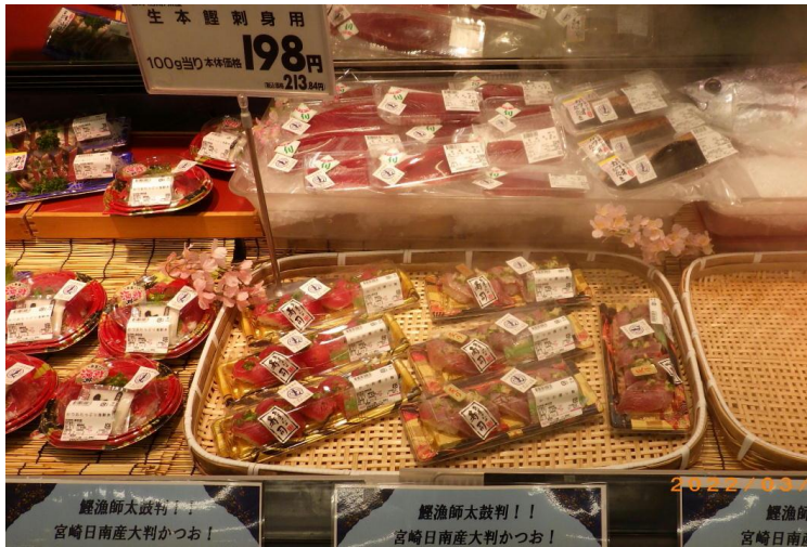
イオン宮崎店での販売状況