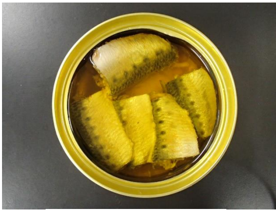
オイルサーディン

これまで当センターで作成した試作品の一部を紹介しますと、真空巻締器や高温高圧蒸気滅菌器を利用した缶詰のオイルサーディン、高温高圧蒸気滅菌器や真空包装機を利用したレンコダイ丸ごとレトルト商品、スモークハウスを利用した魚ジャーキー、スチームコンベクションオーブンを利用したオオニベのフレークなど様々な試作品の作成を行っています。