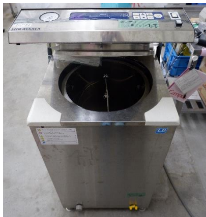
高温高圧蒸気滅菌器