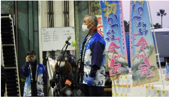
宮崎市中央卸売市場内