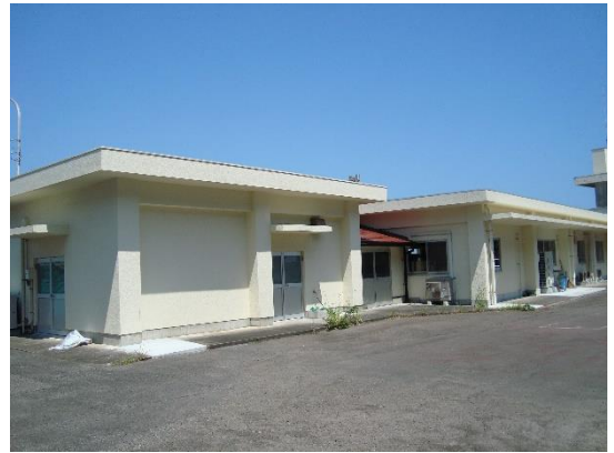
水産物加工指導センター

また、新商品の試験販売を行う際の製造を当センターの機器を用いて製造することができる、フード・オープンラボも運用しており、新商品のテスト販売等を支援しています。