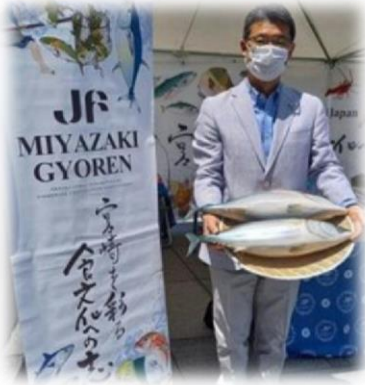
河野知事も応援!! 「食×農×音楽の祭典」(2022.5.3)

宮崎初かつおフェア実行委員会 〔宮崎のさかなビジネス拡大協議会〕 〔宮崎県おさかな普及協議会連合会〕