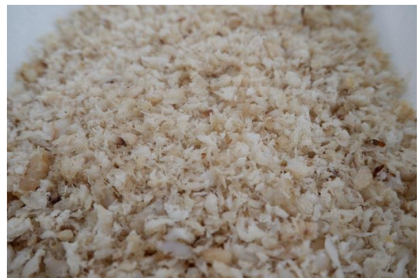
オオニベフレーク