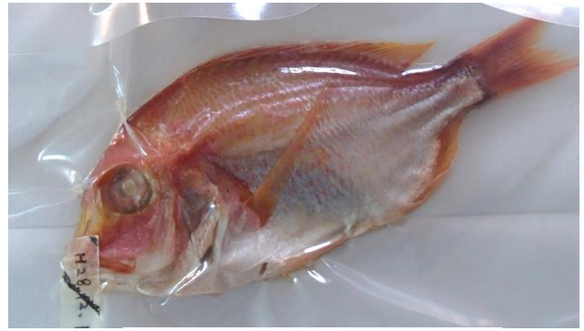
レンコダイ丸ごとレトルト