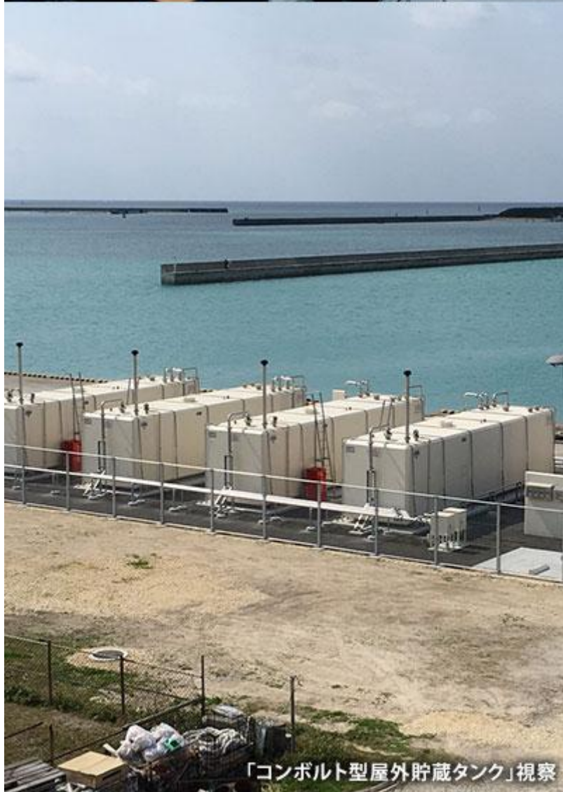
「コンポルト型屋外貯蔵タンク」視察